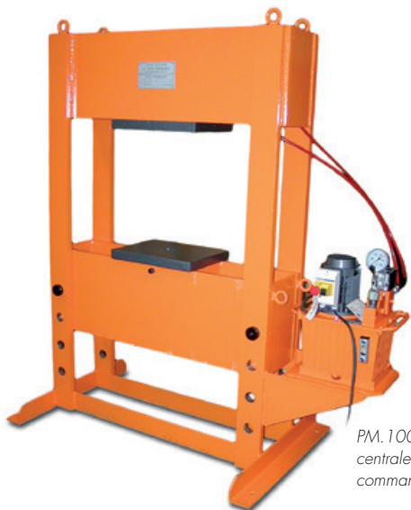
PM.100.250 avec centrale électrique à commande manuelle