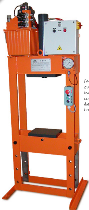
PM.14.420 avec centrale hydraulique à commande électrique par boîte à boutons

Les presses hydrauliques à table mobile de la gamme PM sont conçues pour les gros travaux de montage, de démontage d'assemblages serrés, de redressage de pièces ou tous travaux nécessitant des efforts importants. Adaptables à la demande que ce soit en terme de dimensions, de puissance, de course ou de distribution, les presses standards peuvent servir de base de discussion pour la définition de votre solution idéale.